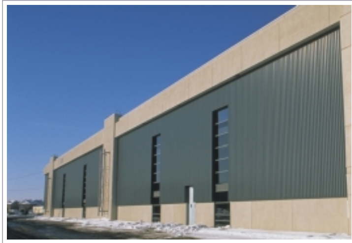
Le capteur solaire Solarwall de Conserval

Le Laboratoire de recherche en diversification énergétique de CANMET (LRDEC), situé à Varennes, au Québec, s'intéresse de près à la production d'électricité par énergie solaire à