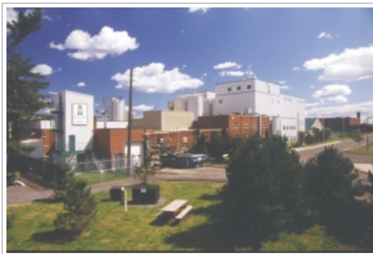
L'usine d'éthanol provenant de produits de la biomasse appartenant à la société Iogen

L e secteur des énergies renouvelables au Canada est en progression constante depuis dix ans. En effet, il y a dix ans, le marché intérieur des énergies renouvelables était très limité. Depuis, la bioénergie a joué un rôle important, suivie par les petites centrales hydro-électriques. L'énergie éolienne et l'énergie solaire ont toujours été considérées comme trop coûteuses pour des utilisations pratiques. Aujourd'hui, cependant, le secteur canadien des énergies renouvelables répond à plus de 6 p. 100 des besoins énergétiques au Canada – ce qui permet ainsi d'éliminer 36 millions de tonnes les émissions de CO 2 chaque année. Le secteur canadien de l'équipement et des services liés aux énergies renouvelables s'est développée jusqu'à compter plus de 250 sociétés, 3 700 emplois et 1,4 milliard de dollars en biens et services (y compris des exportations totalisant 400 millions de dollars).