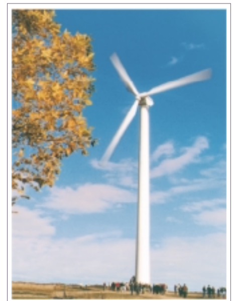
Énergie éolienne au Canada

Les domaines qui présentent un intérêt particulier sont ceux du chauffage de l'air pour la ventilation en zones industrielles, du chauffage de l'eau domestique, du