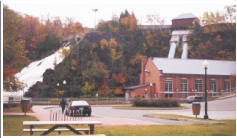
Petite centrale hydro-électrique de Rivière-du-Loup

démontrer que les huiles et graisses à friture usées peuvent être transformées en combustible diesel à indice de cétane élevé à l'aide d'une technique classique de raffinage du pétrole.