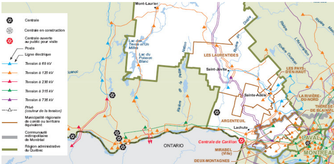
Carte du réseau électrique d'Hydro-Québec en 2005 Source des limites administratives : Ministère des ressources naturelles – SDA, janvier 2006