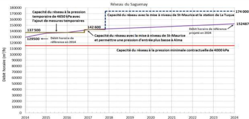
Graphique 2 – Résumé des mesures recommandées au Saguenay b

Cette solution procure une marge pour rencontrer la demande de nouveaux clients qui ne sont pas explicitement pris en compte dans le scénario de référence, et notamment du fait que cette demande a peut-être été sous-évaluée tel que nous en faisons part à la section 3.3 des présentes.