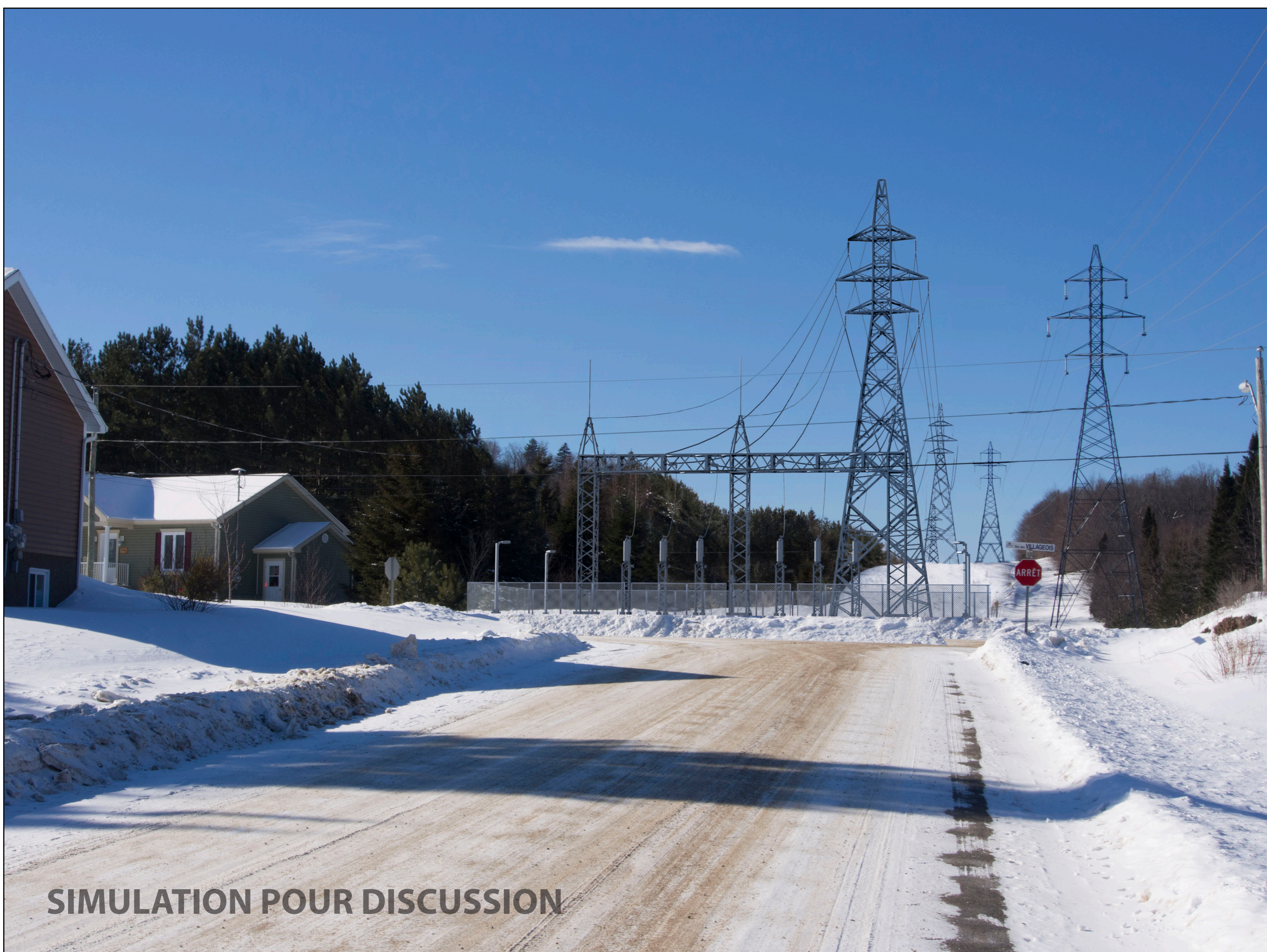
Situation future Direction ouest