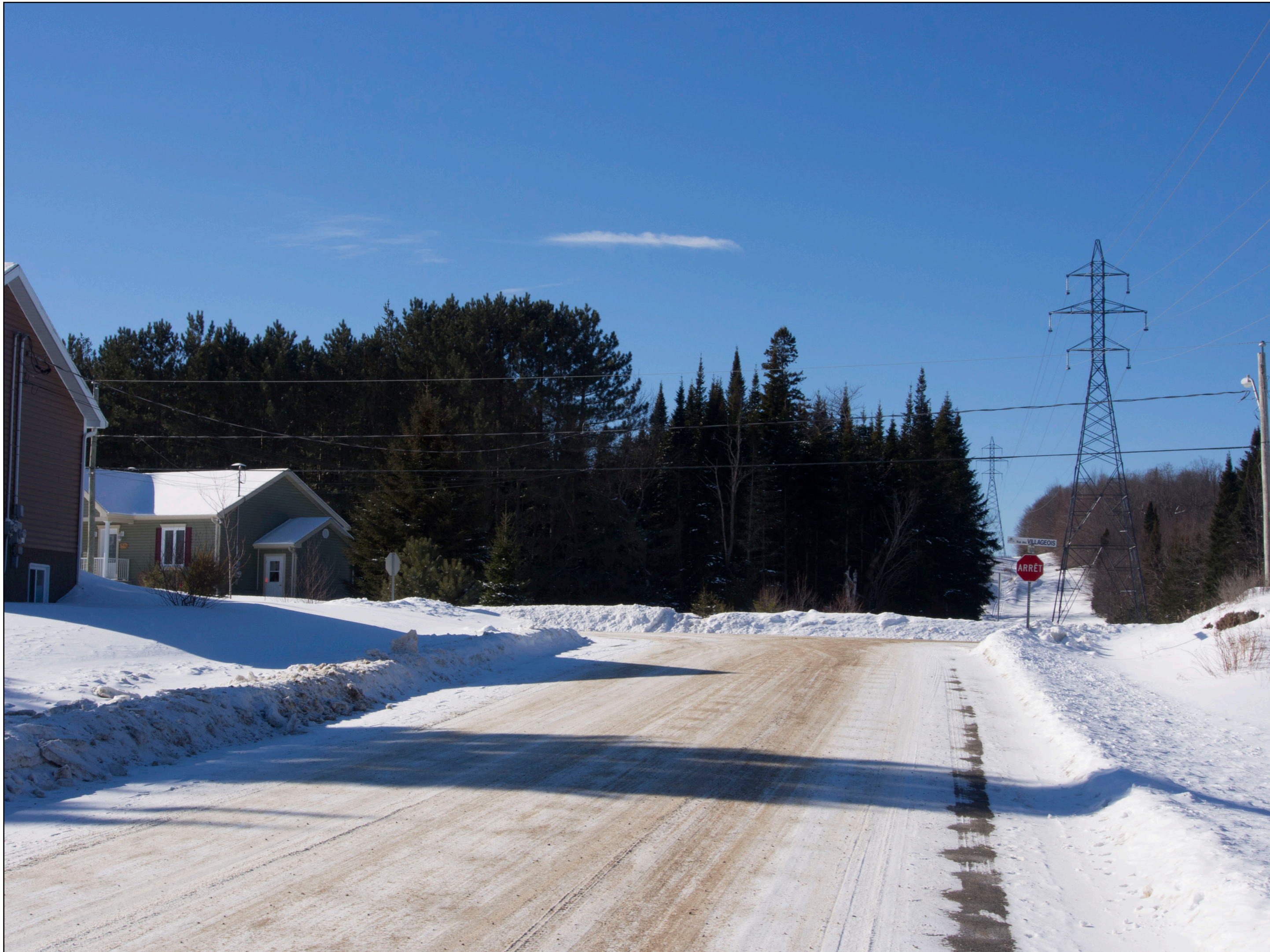
Situation actuelle Direction ouest