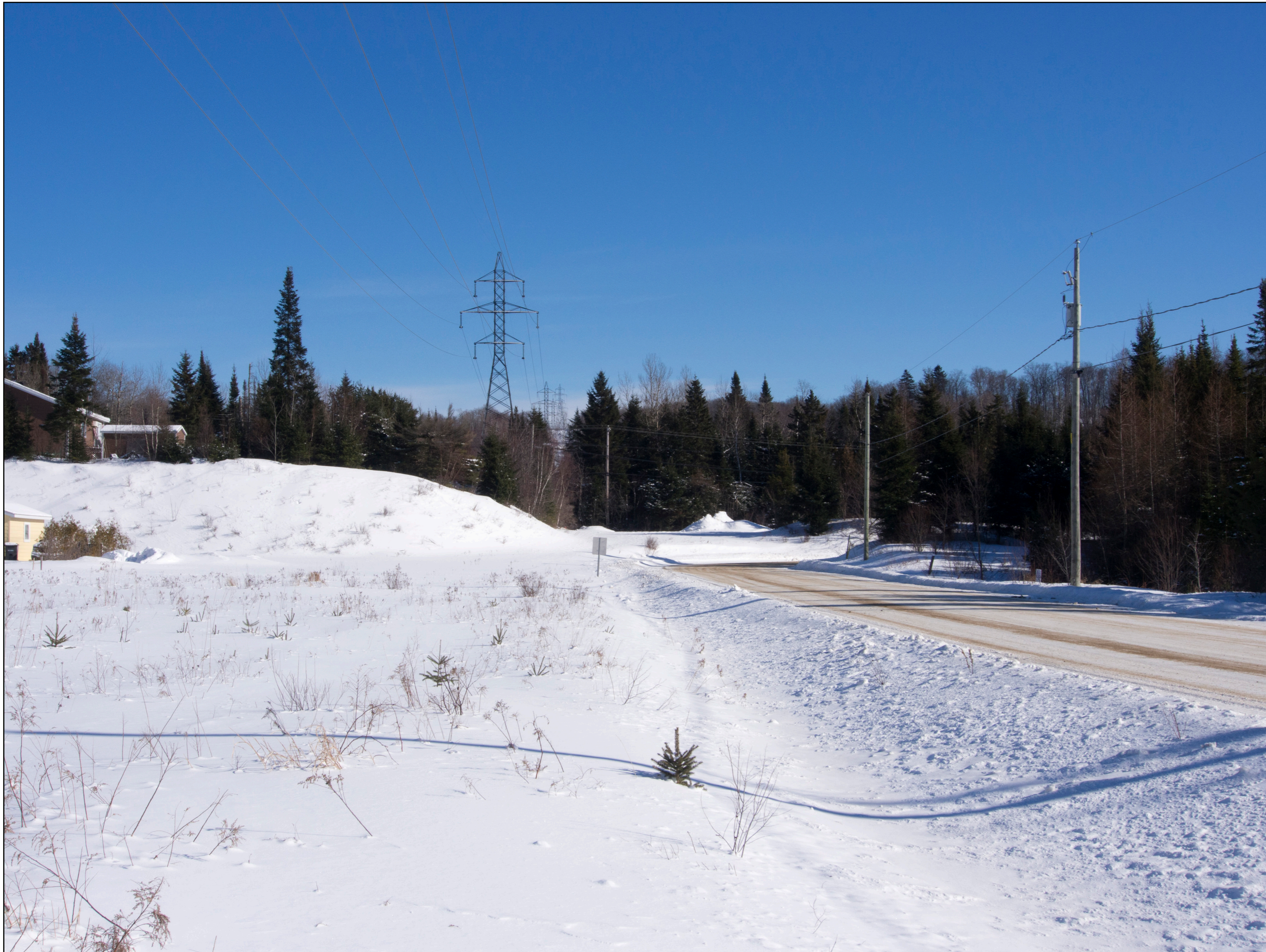
Situation actuelle Direction est