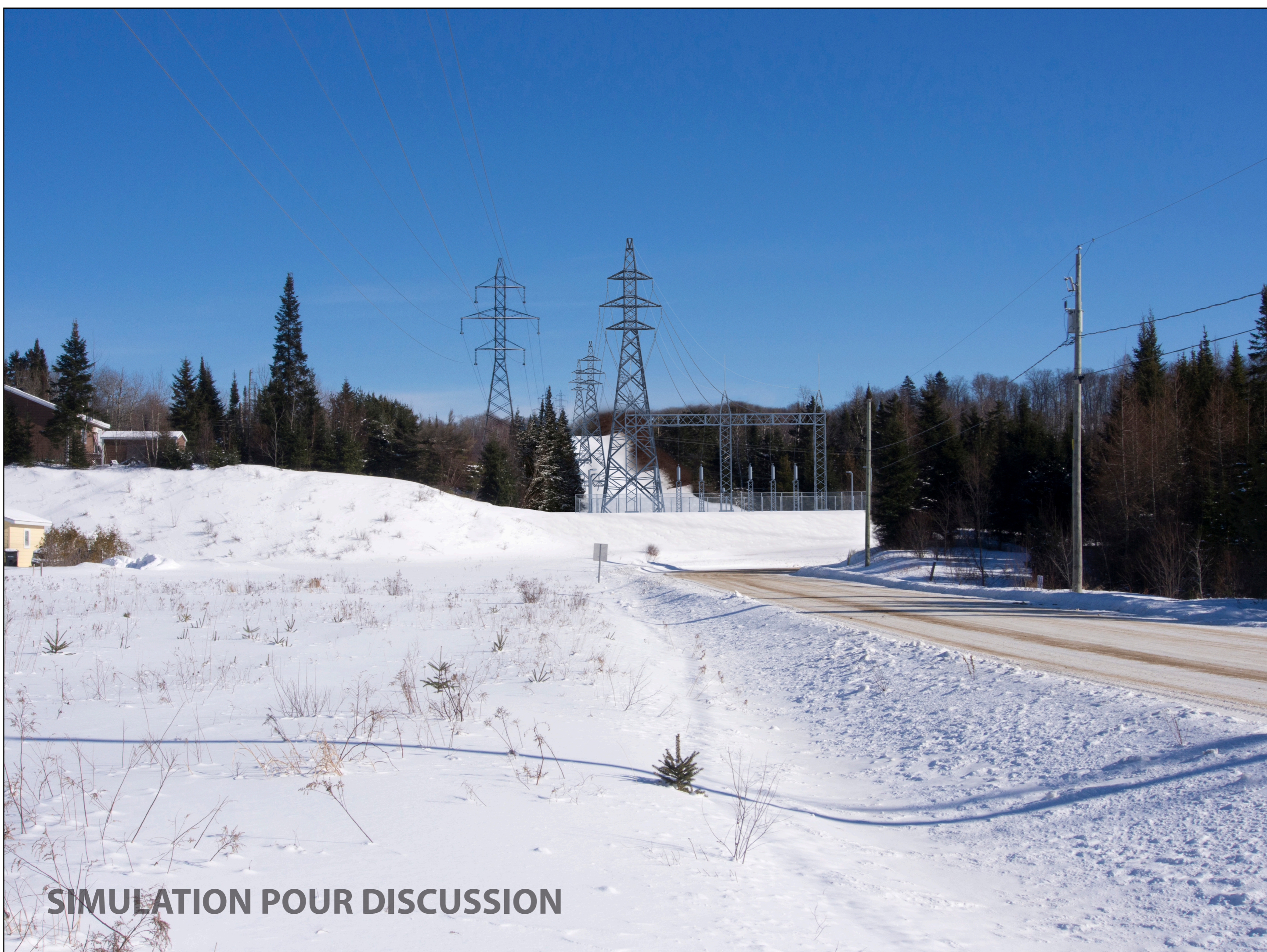
Situation future Direction est