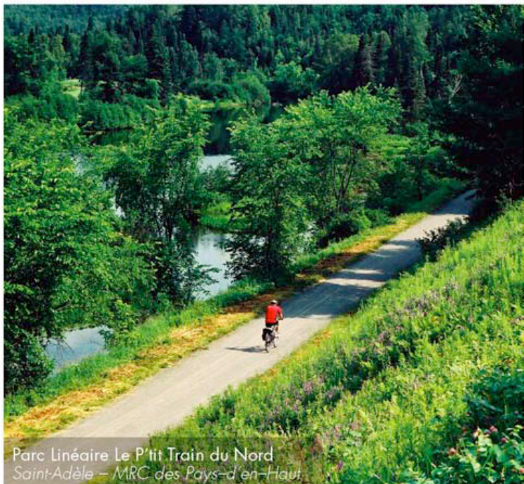
Parc Linéaire Le P'tit Train du Nord Saint-Adèle – MRC des Pays-d'en-Haut

III. Le paysage est à la fois le résultat et la reconnaissance des occupations successives du territoire. Il évolue constamment et à des échelles diverses.