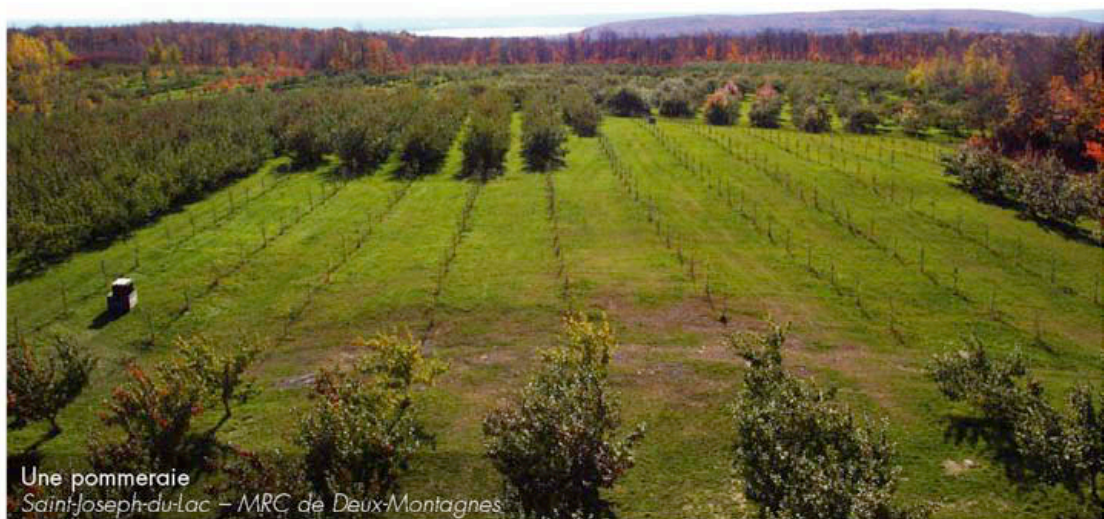
Une pommeraie Saint-Joseph-du-Lac – MRC de Deux-Montagnes

Bureau du cinéma et de la télévision Argenteuil-Laurentides (BCTAL)