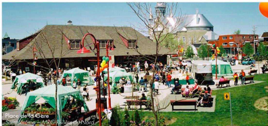
Place de la Gare Saint-Jérôme — MRC Rivière du Nord