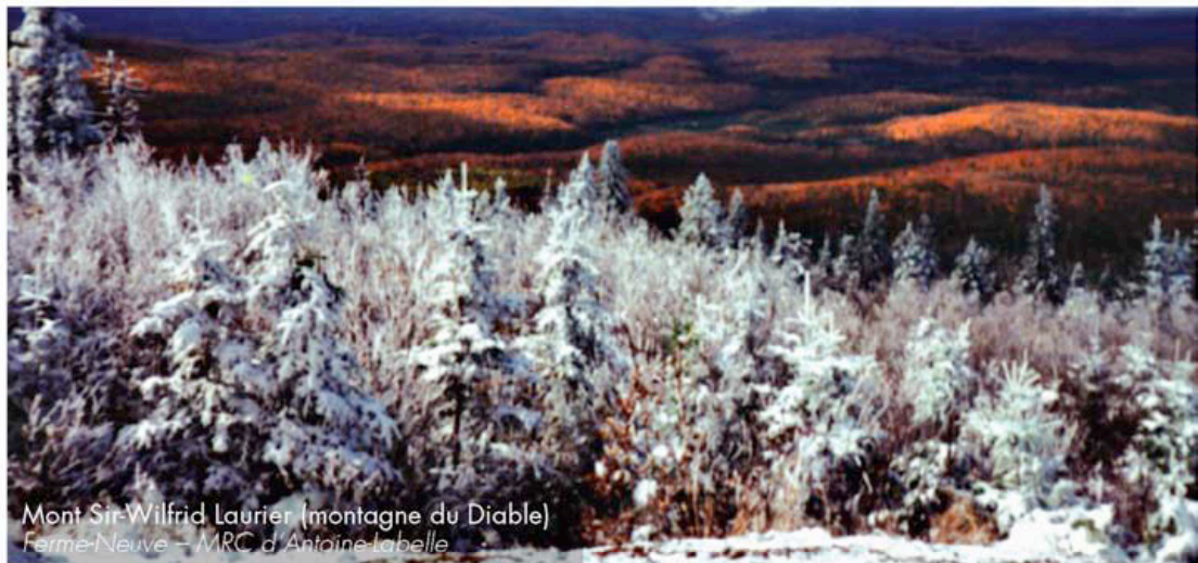
Mont Sir-Wilfrid Laurier (montagne du Diable) Ferme-Neuve – MRC d'Antoine-Labellle