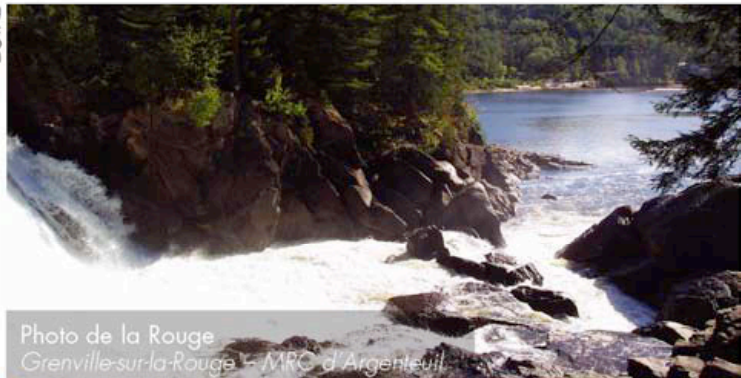
Photo de la Rouge Grenville-sur-la-Rouge - MRC d'Argenteuil