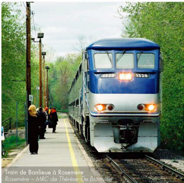
Train de Banlieue à Rosemère Rosemère – MRC de Thérèse-De Blainville