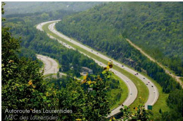
Autoroute des Laurentides MRC des Laurentides

Entente cadre de développement de la région des Laurentides 2001-2006