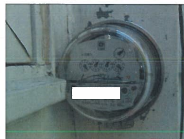
Dégagement – cadre fenêtre