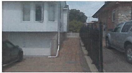
Hauteur et pente