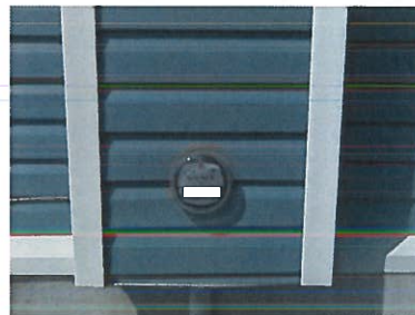
Encastré - revêtement