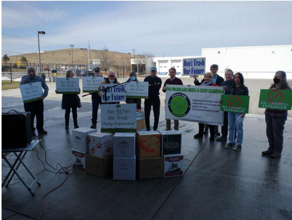
Groups gathered Feb. 21 to release a letter signed by over 1,000 organizations, environmental advocates, concerned citizens and regional business owners urging Governor Hochul to deny Seneca Meadows Landfill (SMI) its expansion request.

Staff Reports Feb 28, 2022 Updated Feb 28, 2022 0