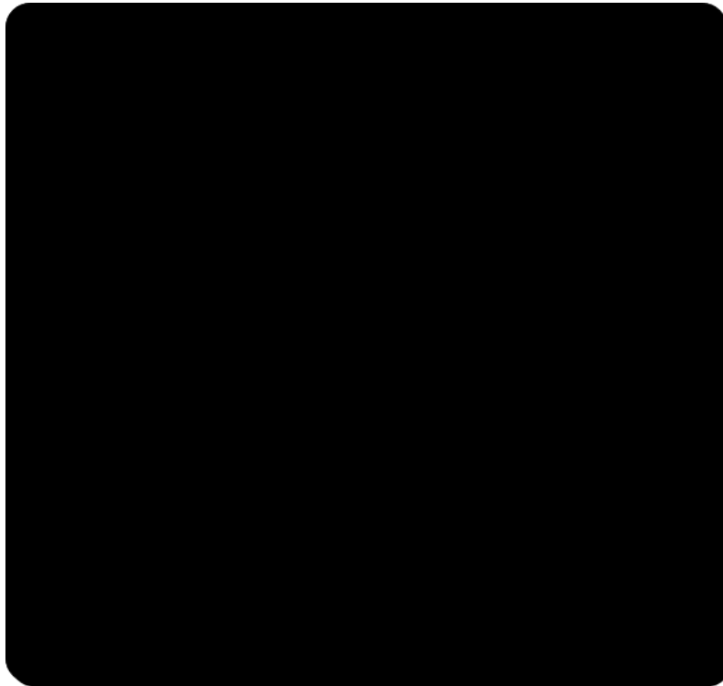
Figure 1 Répartition des coûts internes et externes pour la phase projet