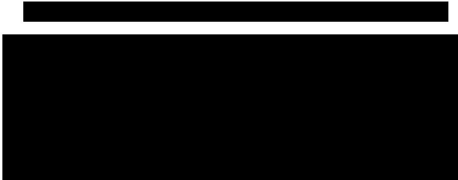
TABLEAU 13 SUIVI AU 31 DÉCEMBRE 2018