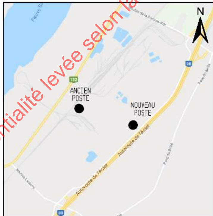
PLAN DE LOCALISATION ÉCHELLE: AUCUNE