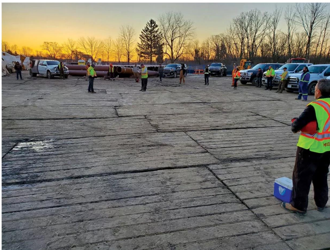
An Enbridge morning meeting with employees practising social distancing