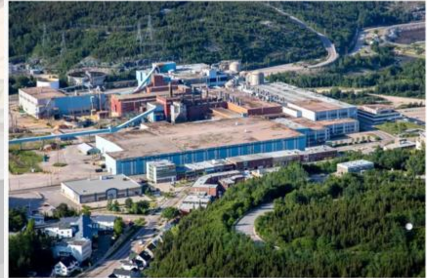
L'usine de papier journal de Résolu au centre-ville de Baie-Comeau

Après celles de Thurso, d'Amos et de Baie-Comeau, deux autres papeteries risquent de fermer d'ici cinq ans. Parmi la dizaine d'usines vulnérables, trois ou quatre devront être modernisées avec l'aide de l'État puisque la pérennité des activités forestières et de sciage de la province en dépend.