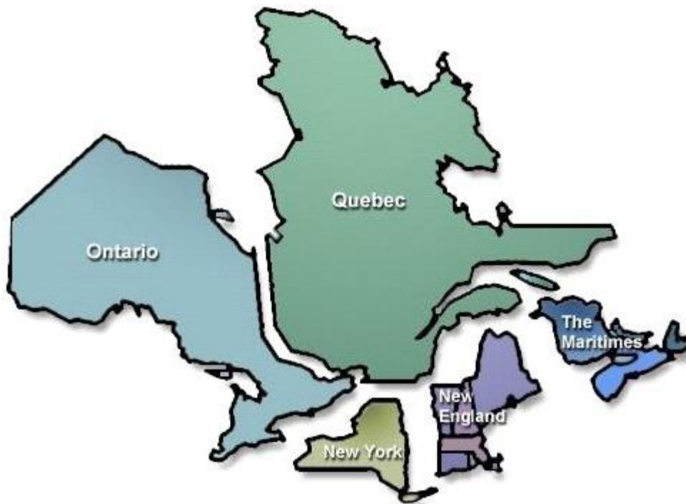
Figure 1 Zones géographiques du NPCC

1 l'exploitation du réseau principal et les règles relatives aux études de réseau. Ces de rnières 2 regroupent les limites d'exploitation du réseau comme, par exemple, la tension, la fréquence, 3 les transits, de même que le contrôle de la puissance réactive, la représentation de la charge 4 et les hypothèses de simulation. Les critères de conception visent notamment à contrer deux 5 types de perturbations possibles sur le réseau, les événements de base et les événements 6 exceptionnels. Ils découlent des normes et des critères élaborés par la North American 7 Electric Reliability Corporation (« NERC ») et par le Northeast Power Coordinating Council, 8 Inc. (« NPCC »), organismes de fiabilité reconnus en Amérique du Nord. Le Transporteur 9 rappelle qu'il applique les normes et critères de ces organismes depuis plusieurs années, en 10 plus d'appliquer ses propres critères internes spécifiques à son réseau de transport. La 11 figure 1 présente les zones géographiques du NPCC.