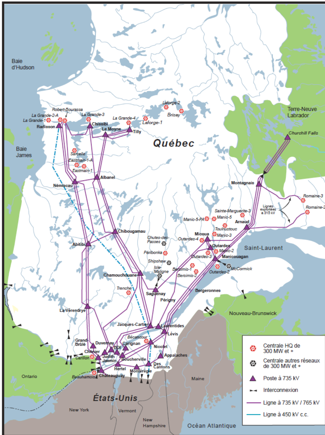
Figure 2 Réseau de transport du Transporteur en date du 31 décembre 2020