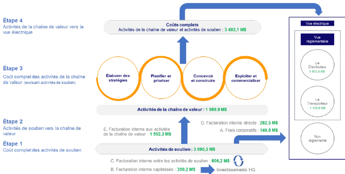
FIGURE 6 : RAPPEL DE LA SÉQUENCE DU CHEMINEMENT DES COÛTS DE LA MCC ADAPTÉE 5

(iii) Hydro-Québec fournit le coût complet des activités de la chaîne de valeur au tableau suivant :