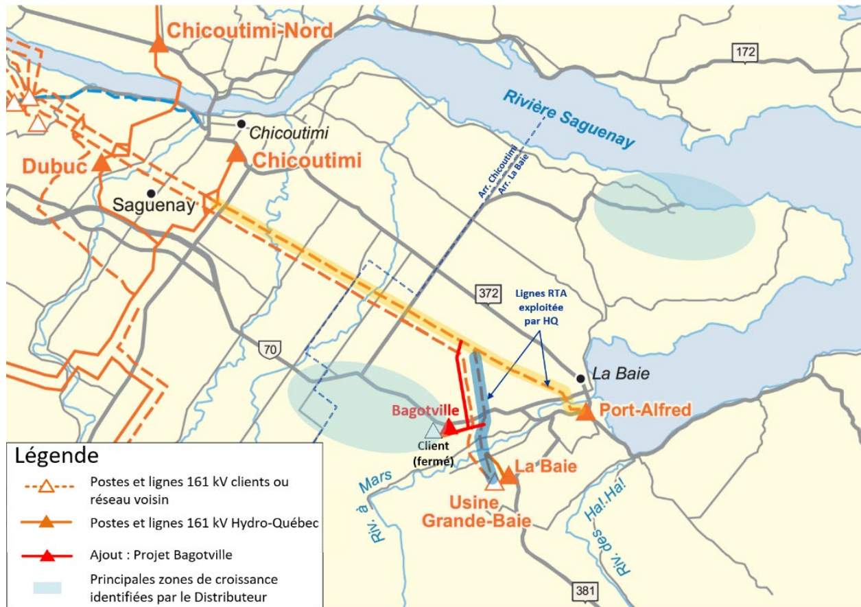
Figure 1 Emplacement géographique des postes de La Baie et de Port-Alfred 1