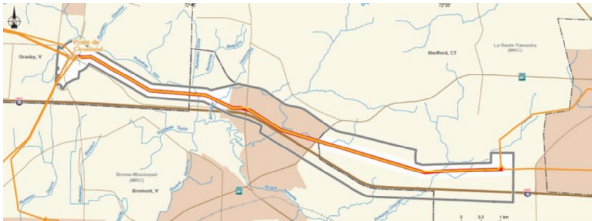
Figure 2 Portion de la ligne Cleveland-Waterloo visée par le Projet

Notes : Tracé de la nouvelle ligne biterne en rouge, tracés des lignes actuelles à 120 kV en orange et zone d'étude du projet encadré en gris.