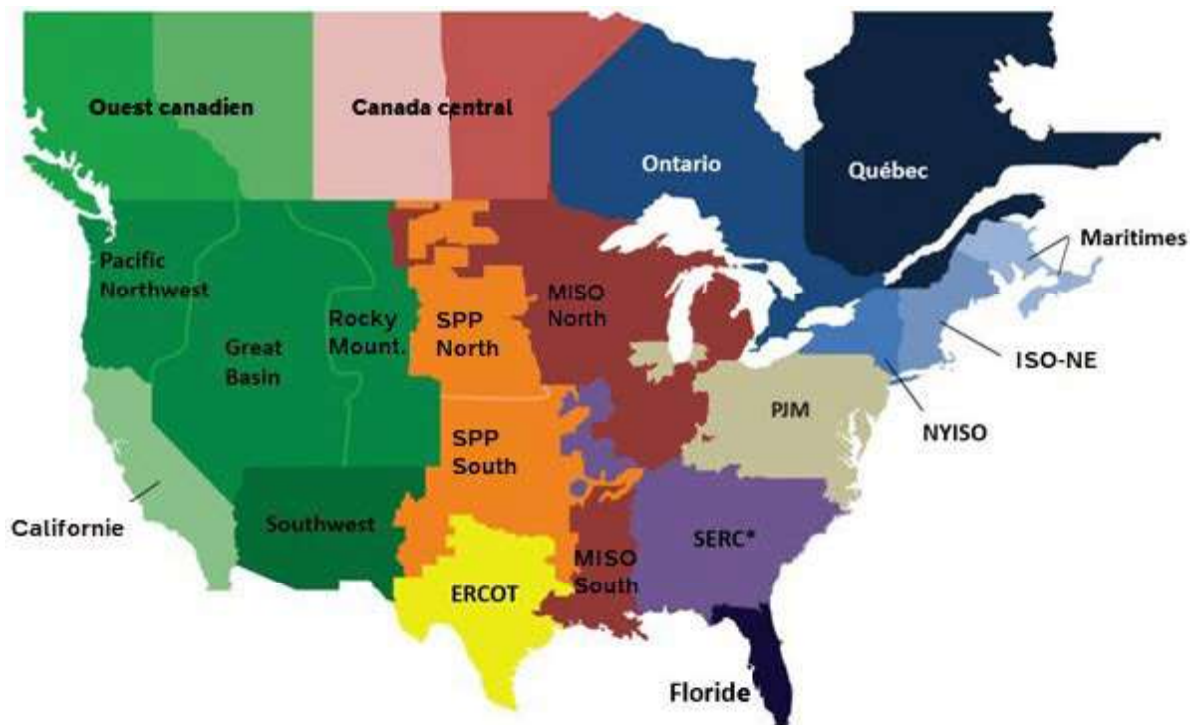
Carte des secteurs météorologiques à utiliser pour l'application de la norme TPL-008-1

La carte ci-dessous présente une approximation des secteurs à utiliser dans l'évaluation des températures extrêmes et est fournie à titre d'aide visuelle. En cas de divergence entre cette carte et le tableau, c'est le tableau qui prévaut. Les informations contenues dans la carte ne doivent pas être utilisées aux fins de mise en conformité.