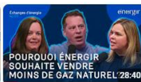
La transformation de notre