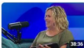
Notre rôle d'énergéticien