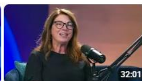
Le réseau d'Énergir