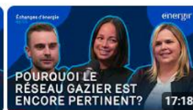
La place d'Énergir au Québec