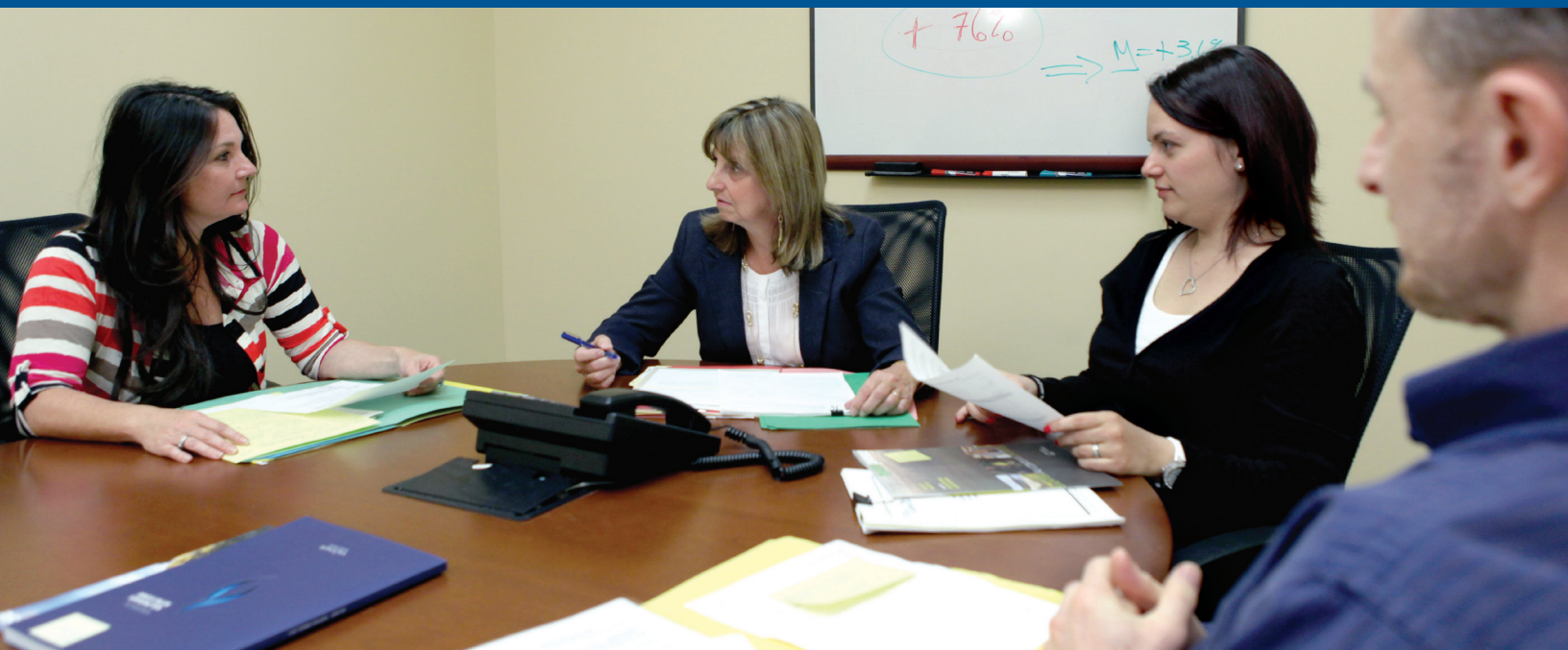
Séance de conciliation réunissant les deux parties et le conciliateur.